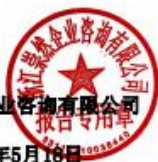
重点排放单位信息表